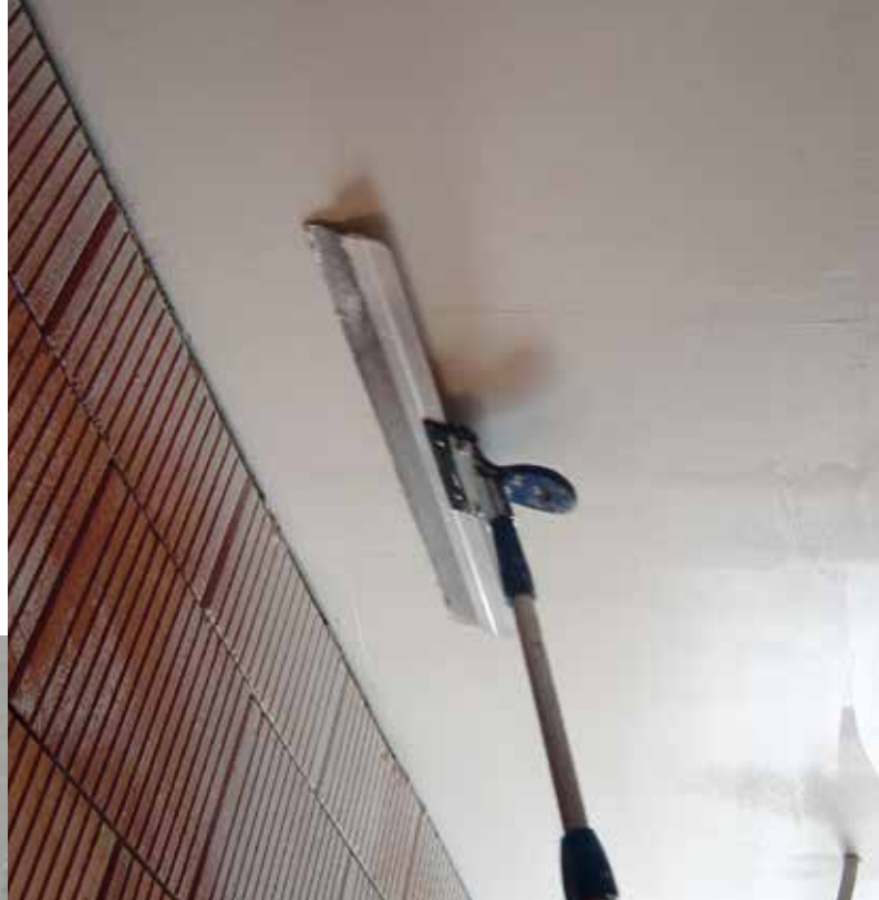
Zaglajevanje izravnalne mase na stropu