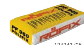
124243 (25 kg), 140663 (5 kg)