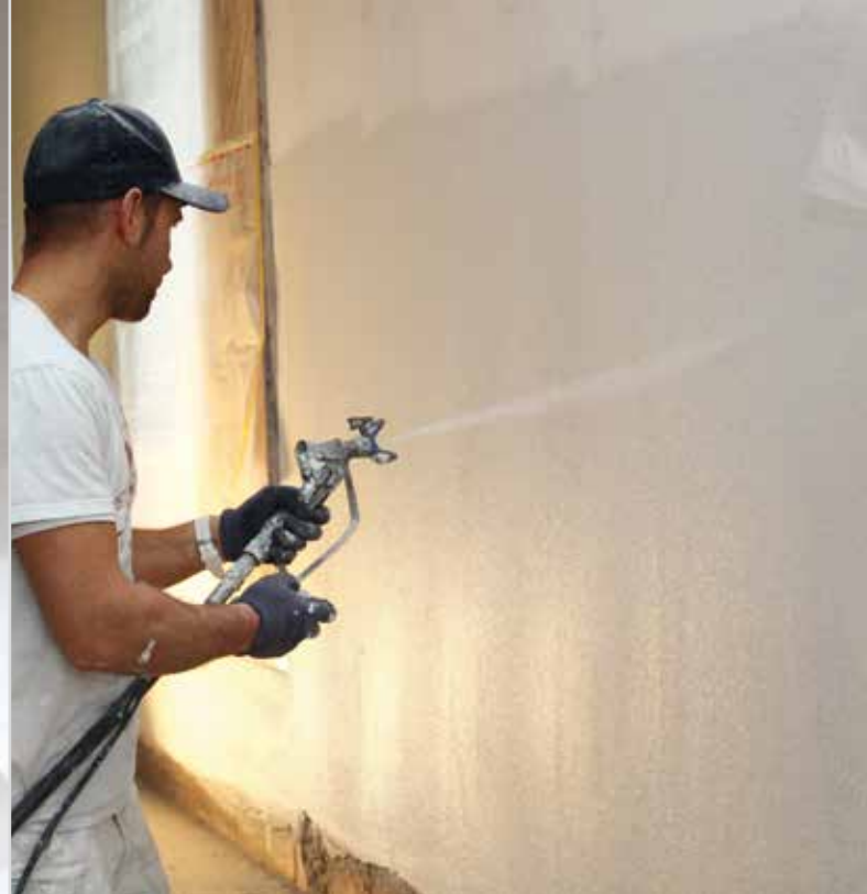
Strojno nanašanje izravnalne mase