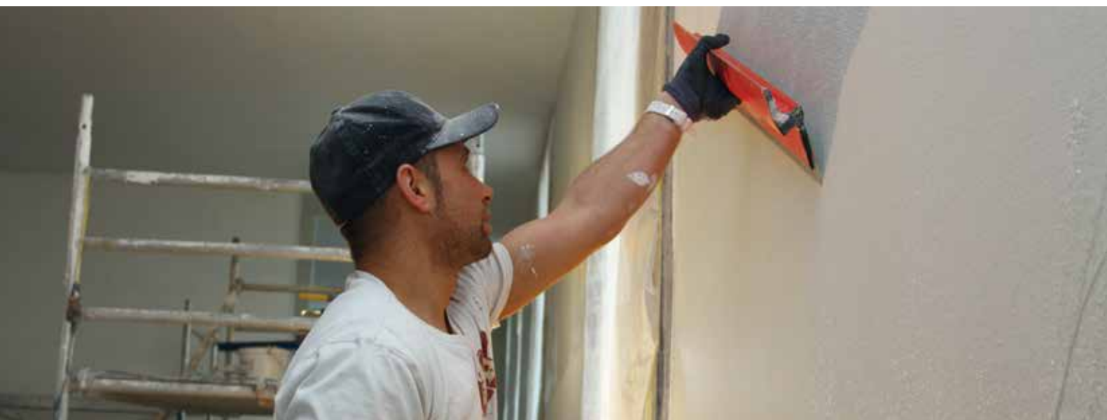
Ročno nanašanje izravnalne mase

Da bi izpolnjeval zahteve stroke, je RÖFIX razvil notranji sistem, imenovan RÖFIX POLISISTEM, kot preverjeno kombinacijo enostavnega in učinkovitega oblikovanja notranjih prostorov.