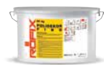
144599 (25 kg)