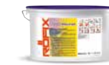
5 lit./15 lit.