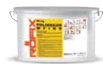
144600 (25 kg)