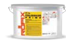
144598 (25 kg)